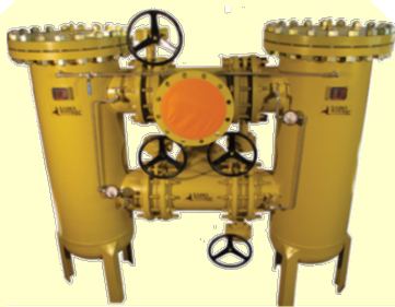
ایستگاه های فیلتراسیون در ظرفیت و سایز های مختلف جهت مصارف نفت و گاز

✓ شرکت سایناتک طی قرارداد انتقال تکنولوژی از شرکت VEMMTEC آلمان که شامل فرید Know How و تجهیزات مورد نیاز سافت می باشد ، تولید کننده انواع فیلترهای گاز و استرینرهای مایعات جهت صنایع نفت ، گاز و پتروشیمی با رعایت استانداردهای معتبر بین المللی بوده و هم اکنون محصولات این شرکت به آلمان صادر می گردد.