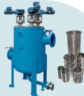
انواع فیلترهای اتو کلین در ظرفیت و سایز های مختلف با سبدهای نوع WEDGE WIRE