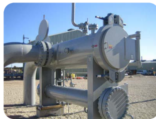
فیلتر سپراتور (Filter Separator) در ظرفیت و سایز های مختلف جهت ورودی ایستگاه های گاز